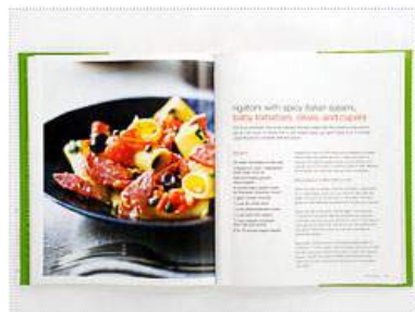
實際投影畫面：投影書籍全開頁面