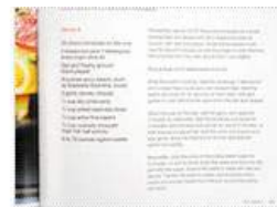
實際投影畫面：捕捉局部範圍